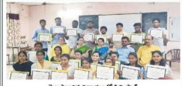
గెలుపొందిన విద్యార్థులతో ప్రెస్ నోట్