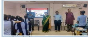
సర్దార్ వల్లభాయి పటేల్ జన్మదిన సందర్భంగా ఆయన చిత్రరూపం వద్ద దేశోత్సవ చర్యలు జరిగింది.